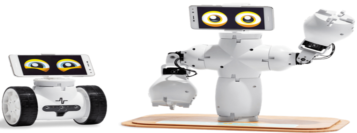
Fable-robotten (til venstre en robot med et hjulmodul og til højre en robot med to ledmoduler)